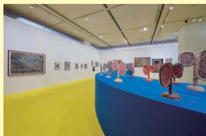
「梅津庸一 クリスタルパレス」

特別展「梅津庸一 クリスタルパレス」を開催しています(大学生以上は有料)。美術家・梅津庸一(1982-)の、多彩な抽象ドローイング、映像、陶芸、版画などの作品をご覧いただけます。