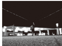
《日々“hibi” 13 full moons》

《日々“hibi” 13 full moons》 (SD-digital / 2005年 / 96分)