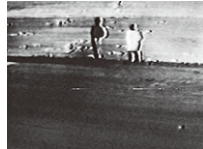
《FORGET AND FORGIVE》

《20》 (VHS-video / 1990年 / 5分) 《FORGET AND FORGIVE》 (VHS-video / 1991年 / 14分)