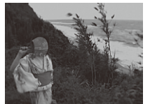
《中也を想い、サンボする》

《Wedding 結縁》 (DV, SD-digital / 2007年 / 15分) 製作：佐野画廊