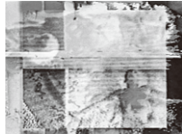
《VIDEO SWIMMER IN BLUE》

《VIDEO SWIMMER IN BLUE》 (VHS-video / 1992年 / 12分)