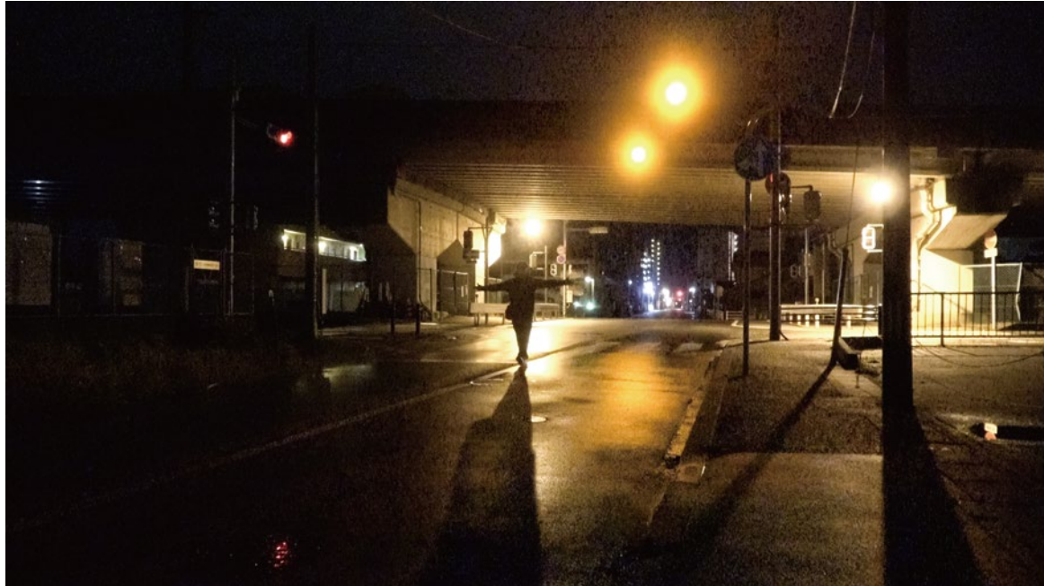
《日々 "hibi" AUG》