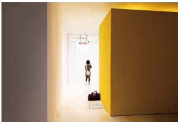
右:「デコレータークラブ 配置・調整・周遊」2020年、「ヨコハマトリエンナーレ2020」(プロット48、2020年)の展示風景、撮影:飯川雄大