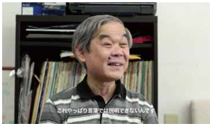
左:「デコレータークラブ—衝動とその周辺にあるもの—」2016年、ビデオ(18分)