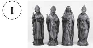
1 アルント・ファン・ズヴォレ? 《四大ラテン教父：聖アウグスティヌス、 聖アンブロシウス、聖ヒエロニムス、 聖グレゴリウス》