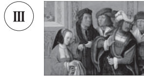
23 ルカス・ファン・レイデン 《ヨセフの衣服を見せる ポテパルの妻》