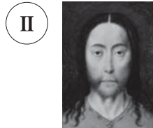
8 ディーリック・バウツ 《キリストの頭部》