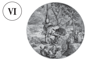
51 ヒエロニムス・ボス 彫版師不詳 《樹木人間》