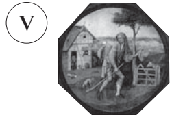
41 ヒエロニムス・ボス 《放浪者（行商人）》