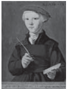
38 ヤン・ファン・スコレル 《学生の肖像》