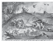
66 ビーテル・ブリュッゲル1世 彫版：ピーテル・ファン・デル・ヘイデン 《大きな魚は小さな魚を食う》