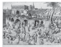
73 ビーテル・ブリュッゲル1世 彫版：フランス・ハイス 《アントウェルペンのシント・ヨーリス 門前のスケート滑り》