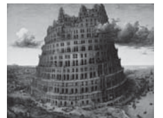
86 ビーテル・ブリュッゲル1世 《バベルの塔》