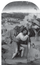
42 ヒエロニムス・ボス 《聖クリストフォロス》