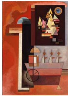
★2. ヴァシリー・カンディンスキー 《絵の中の絵》 1929 年 国立国際美術館蔵