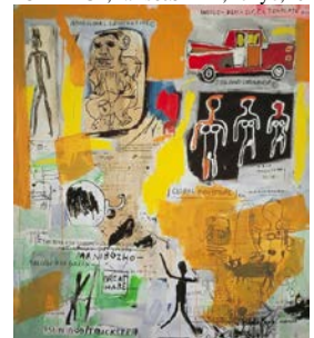
★*11. ジャン＝ミシェル・バスキア 《無題》 1984 年 大阪市立近代美術館建設準備室蔵 ©The Estate of Jean-Michel Basquiat/ADAGP, Paris&SPDA, Tokyo, 2011