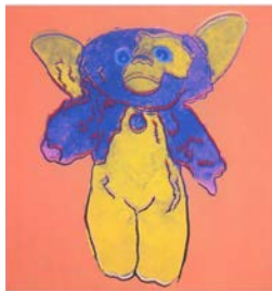
アンディ・ウォーホル 《グレムリン II (オレンジ)》 1986 年 国立国際美術館蔵 ©2011 The Andy Warhol Foundation for the Visual Arts, Inc. / ARS, N.Y. / SPDA, Tokyo