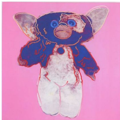
アンディ・ウォーホル 《グムリン I (ピンク)》1986年 国立国際美術館蔵 ©2011 The Andy Warhol Foundation for the Visual Arts, Inc. / ARS, N.Y. / SPDA, Tokyo