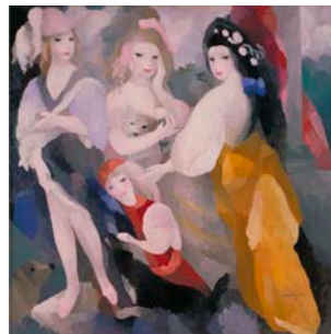
★*10. マリー・ローランサン 《プリンセス達》 1928 年 大阪市立近代美術館建設準備室蔵 ©ADAGP, Paris&SPDA, Tokyo, 2011