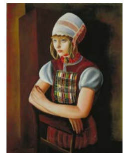
★*7. キスリング 《オランダ娘》 1922 年 大阪市立近代美術館建設準備室蔵