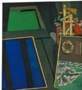
★*5. ジョルジオ・デ・キリコ 《福音書的な静物》 1916 年 大阪市立近代美術館建設準備室蔵