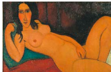
★*6. アメデオ・モディリアーニ 《髪をほどいた横たわる裸婦》 1917 年 大阪市立近代美術館建設準備室蔵