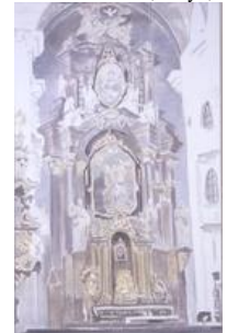
★3. リュック・タイマンス 《教会》 2006 年 国立国際美術館蔵