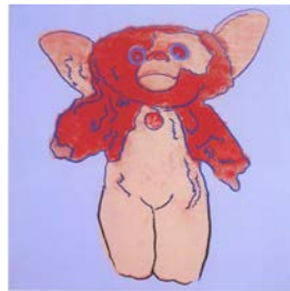
アンディ・ウォーホル 《グレムリン III (ブルー)》 1986 年 国立国際美術館蔵 ©2011 The Andy Warhol Foundation for the Visual Arts, Inc. / ARS, N.Y. / SPDA, Tokyo