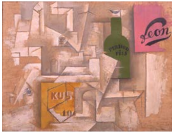
★*1. パブロ・ピカソ 《ポスターのある風景》 1912 年 国立国際美術館蔵 ©2011-Succession Pablo Picasso-SPDA(JAPAN)