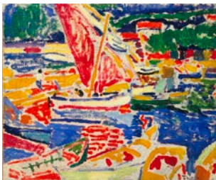
★*4. アンドレ・ドラン 《コリウール港の小舟》 1905 年 大阪市立近代美術館建設準備室蔵 ©ADAGP, Paris&SPDA, Tokyo, 2011