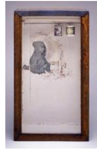
ジョゼフ・コーネル 《無題(北ホテル)》 1950 年代 国立国際美術館蔵