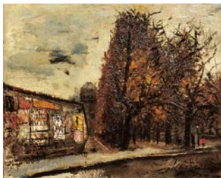
★8. 佐伯祐三 《オプセルヴァトワール附近》 1927 年 大阪市立近代美術館建設準備室蔵