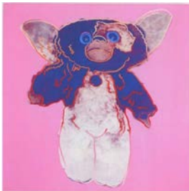
アンディ・ウォーホル 《グレムリン I (ピンク)》 1986 年 国立国際美術館蔵 ©2011 The Andy Warhol Foundation for the Visual Arts, Inc. / ARS, N.Y. / SPDA, Tokyo