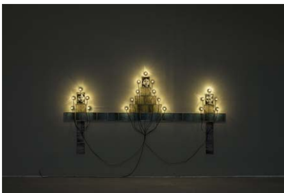
1_クリスチャン・ボルタンスキー《モニュメント》1986年 作家蔵 © Christian Boltanski / ADAGP, Paris, 2019