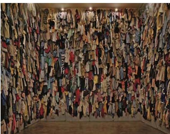
2_クリスチャン・ボルタンスキー《保存室 (カナダ)》1988年 イデッサ・ヘンデルス芸術財団、トロント © Christian Boltanski / ADAGP, Paris, 2019, Ydessa Hendeles Art Foundation, Toronto