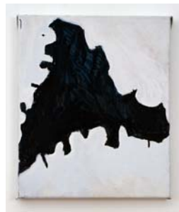
2_ラウル・デ・カイザー 《お化け》2007年 個人蔵 © Raoul De Keyser, courtesy Wako Works of Art