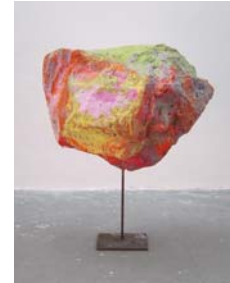
4_フランツ・ヴェスト 《無題》2011年 Estate Franz West, Vienna, © Archiv Franz West, © Estate Franz West