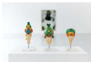
11_リチャード・オードリッチ 《女神》2016年 Courtesy of the artist and MISAKO & ROSEN, © Rik Vannevel