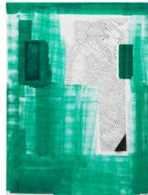
7_ミハエル・クレバー 《MK/M2014/15, MK/M2014/19, MK/M2014/10, MK/M2014/12, MK/M2014/05, MK/M2014/17》 《部分》2014年 Collection of Jennifer and David Millstone, courtesy Galerie Buchholz, Berlin/Cologne/New York