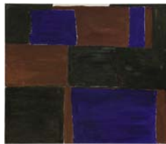
6_ギンター・フォルグ 《無題》1999年 Estate Günther Förg, Suisse, courtesy Hauser & Wirth and Almine Rech