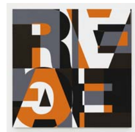
8_ハイモ・ツォーベルニク 《無題》2010年