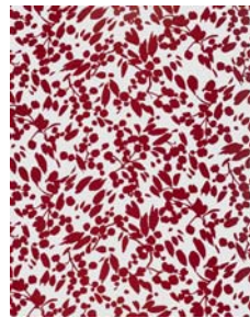
3_ダーン・ファン・ゴールデン 《ヘーレンルックス 1》1993年 Kröller-Müller Museum, Otterlo, The Netherlands, purchased with support of the Board of Fine Arts and Architecture of the Ministry of Culture