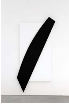
1_エルズワース・ケリー 《斜めの黒いレリーフ》2010年