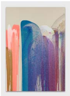
5_ジョン・アムレダー 《大きじ》2016年 Courtesy of the Artist and Almire Rech, © John Armleder, photo: Annik Wetter