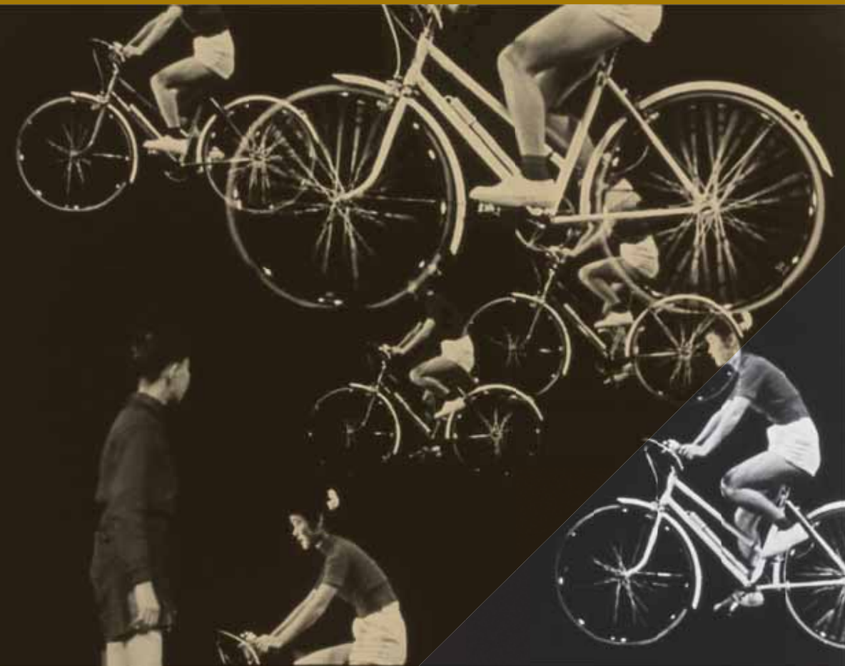
松本俊夫《銀輪》(1956年 / 12分 / カラー / サウンド)