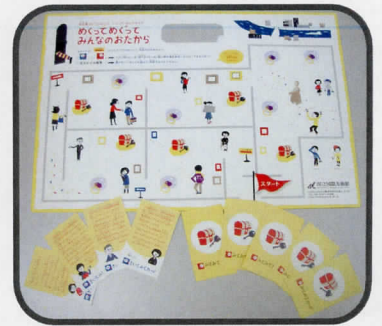
『ジュニア・セルフガイド』

※保護者の方へ → 「中之島コレクションズ」展会期中、今回のツアーで使用する『セルフガイド』は先着順で小学生に配布されます。今回のツアーでは、その『セルフガイド』を美術館スタッフと一緒に用いながら、作品を鑑賞します。