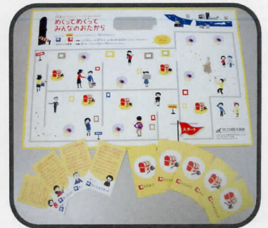
『ジュニア・セルフガイド』

※保護者の方へ → 「中之島コレクションズ」展会期中、今回のツアーで使用する『セルフガイド』は先着順で小学生に配布されます。今回のツアーでは、その『セルフガイド』を美術館スタッフと一緒に用いながら、作品を鑑賞します。